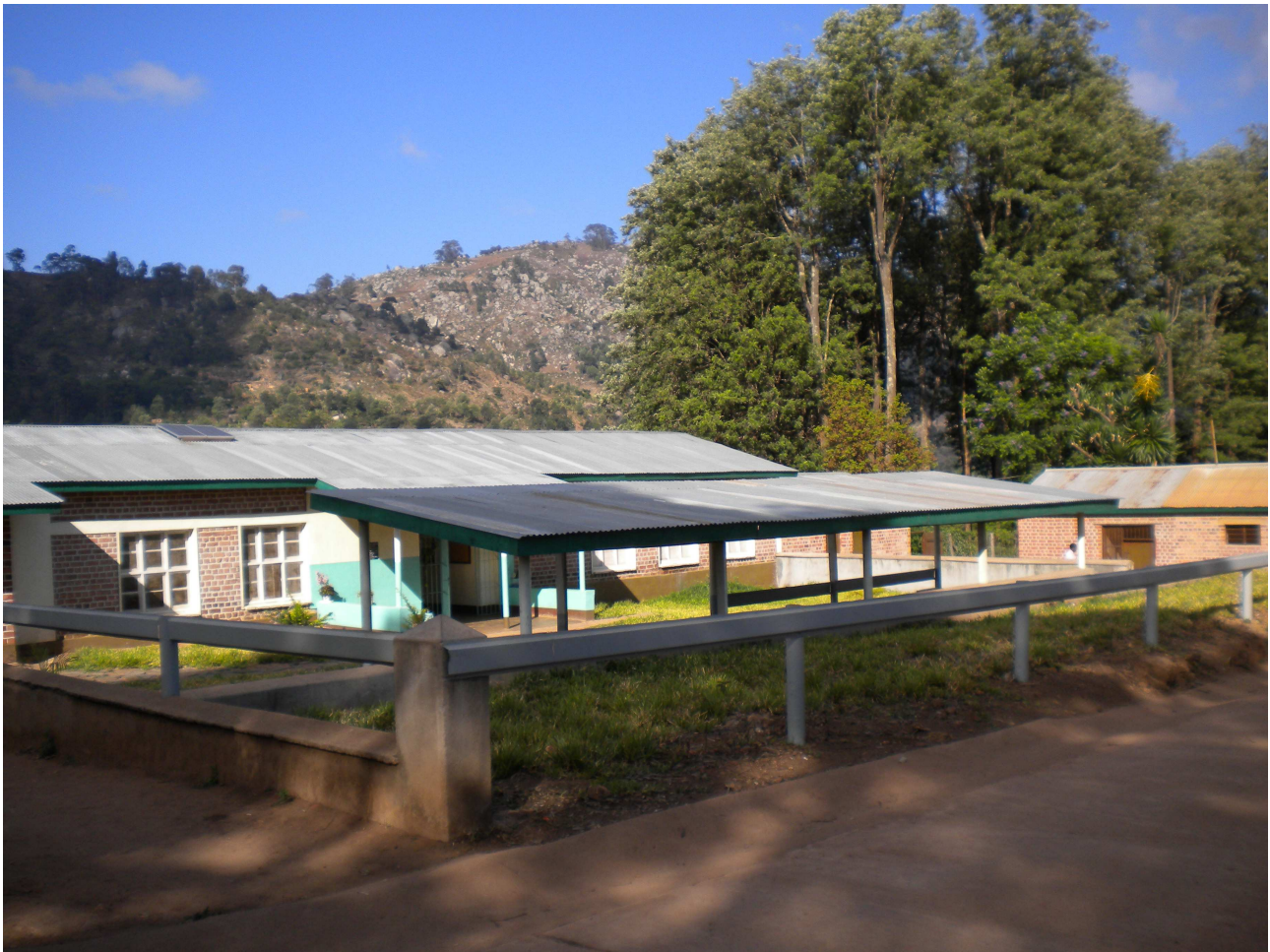
Mutter und Kindstation

Chirurgie, Kinderabteilung, Lager und Apotheke, zwei OP-Säle und die Abteilung für ambulante Behandlung und Verwaltung angebaut. Es gibt auch einen Raum für Reha-Maßnahmen. Außerdem haben wir ein Infirmarie-Gebäude für Priester und eines für Schwestern und ein Gebäude, das der Mutter-Kind-Klinik vorbehalten ist. Dort werden die regelmäßigen Vorsorge-Untersuchungen für Schwangere und Babys durchgeführt.