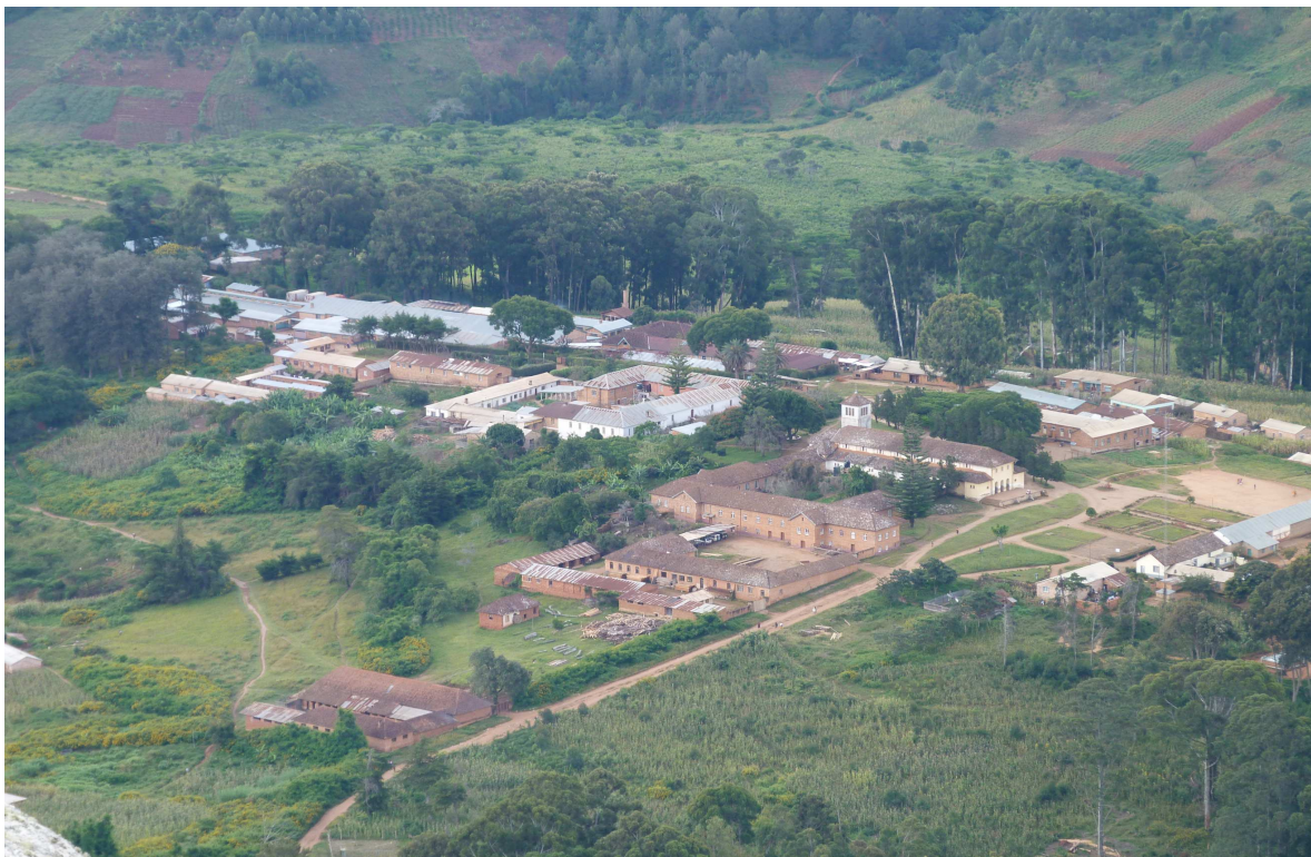
Liteambo Hospital (Buschkrankenhaus)

Mit diesem Brief erhalten Sie noch weitere Informationen über unser Hospital. Unser Hospital besteht aus 10 Gebäuden.